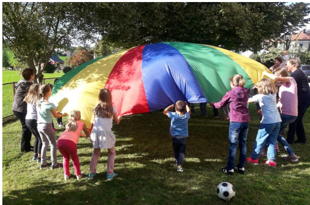
Treffen aller Sonntagsschulkinder im September 2019